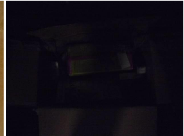
zu dunkel, nicht genug Licht im Raum