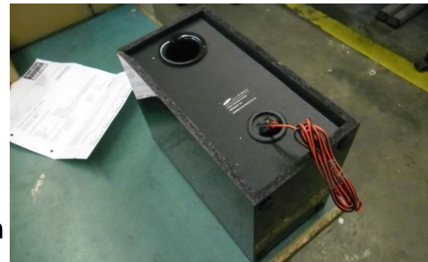
Auf diesem Bild ist kein Schaden zu erkennen →