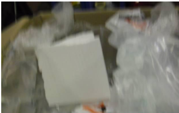
← Bild verwackelt, Kamera wurde nicht ruhig gehalten