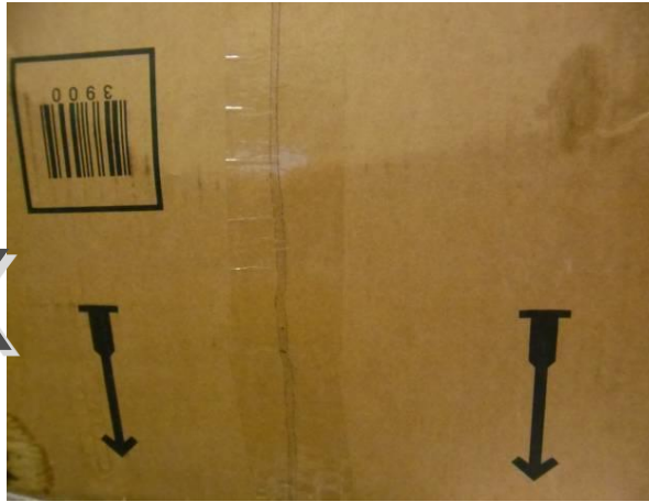
zu nah aufgenommen, Bild sagt nichts aus