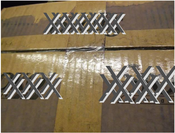
zu nah aufgenommen

Beispiele wie Bilder nicht aussehen sollten: